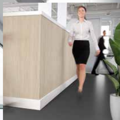
Dekorativa, limfria golv, med 14 dB akustikdämpning och komfort under fötterna

Med våra limfria, 100 % återvinningsbara golv stödjer vi en hållbar utveckling samt bidrar till att eliminera avfallskostnader och undvika deponering.