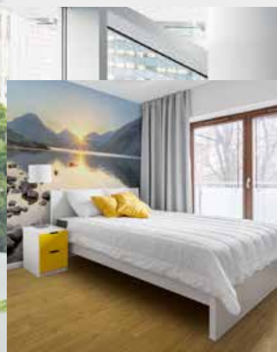
En rad olika designalternativ för möjlighet att skapa lösningar till hela byggnader