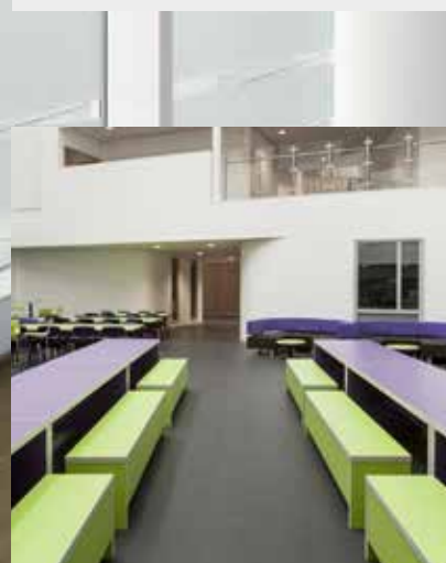
Prisbelönta, limfria, tåliga golv med avancerad EasyClean-teknik